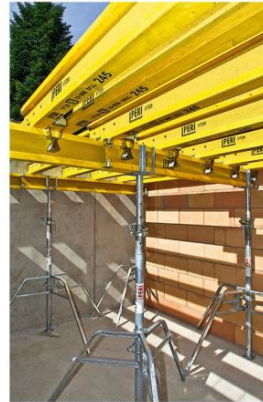
La viga de 20 cm de alto fue desarrollada especialmente para el encofrado de losas. Puede utilizarse como viga transversal y principal.

La viga VT 20 es una viga de alma llena con aglomerado de alta densidad. El alto porcentaje de resina sintética confiere a la viga VT gran estabilidad dimensional. Ha sido desarrollada especialmente para el encofrado de losas, representando una variante mas económica.